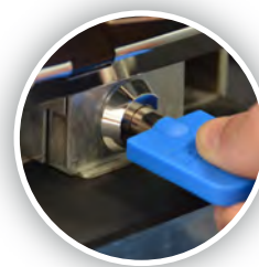
Blocco interno accesso al contante (opzionale)