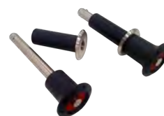
Sistema di ancoraggio rimovibile (opzionale)