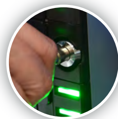
Blocco interno accesso al contante